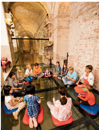
Im Stiftsatelier Klosterneuburg ist Platz für Spiel, Kunst und Gemeinschaft.

Die KünstlerInnen, die international ausstellen und viel herumkommen, bringen ihre Erfahrungen ins Kloster mit, und sie tragen das, was sie bei ihren Recherchen in Admont erleben, in die Welt hinaus. Manche wohnen eine Woche im Stift, andere treffen sich mit den Mönchen zum Gespräch, bleiben zum Essen, schauen sich um, fotografieren, machen Skizzen, schreiben. „Es gibt keine Vorgaben“, so Braunsteiner. Die so entstandenen Kunstwerke verleihen der umfangreichen Sammlung des Stiftes ihren unverwechselbaren Charakter – mit Ansehen weit über die Landesgrenzen hinaus. *