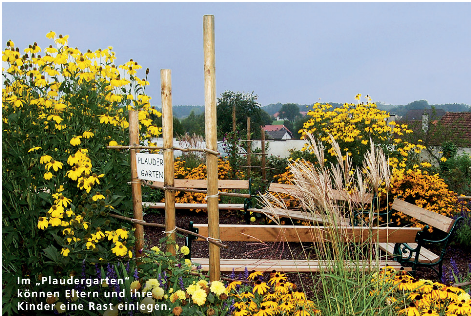
Im „Plaudergarten“ können Eltern und ihre Kinder eine Rast einlegen.