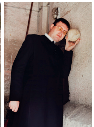
Kunst „Made for Admont“: aus der Serie „Brothers & Sisters“ von Erwin Wurm.