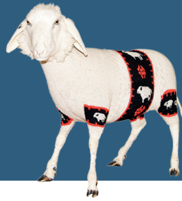
„Schaf im Pullover“ von Deborah Sengl.

Heimische Klöster präsentieren nicht nur historische Schätze. Sie fördern auch zeitgenössische Kunst in den eigenen Mauern.