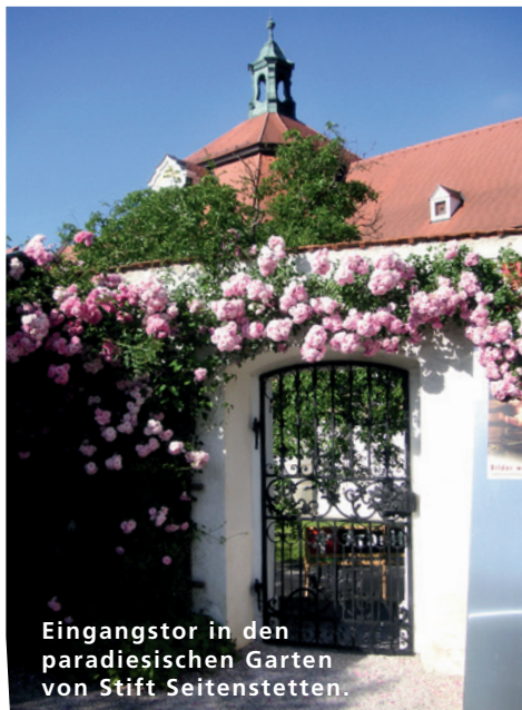
Eingangstor in den paradiesischen Garten von Stift Seitenstetten.