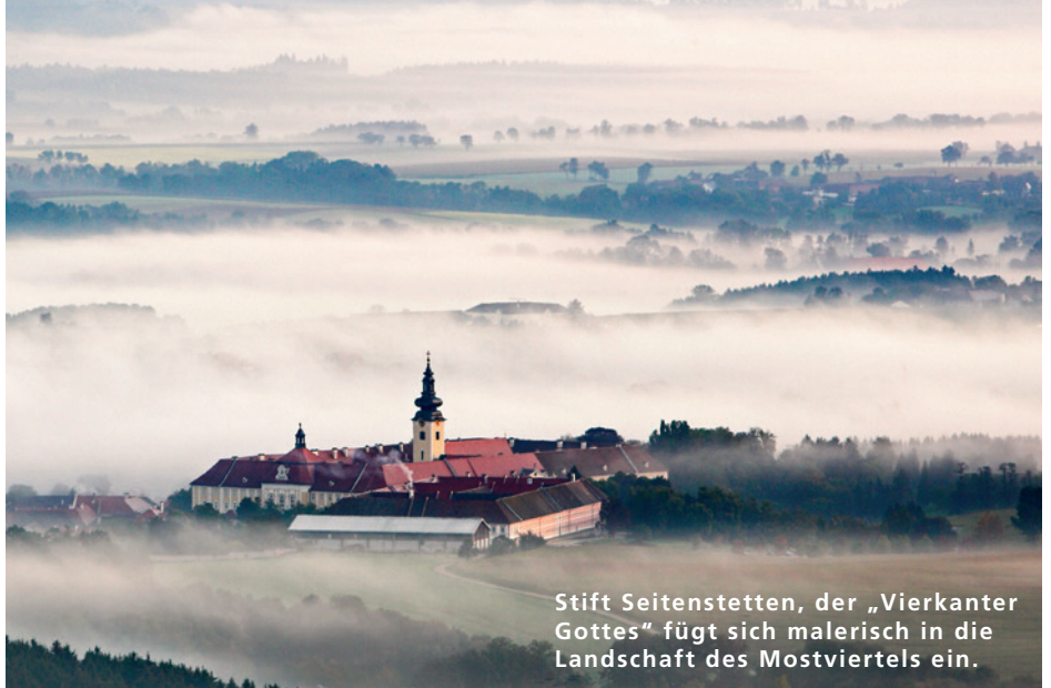
Stift Seitenstetten, der „Vierkanter Gottes“ fügt sich malerisch in die Landschaft des Mostviertels ein.