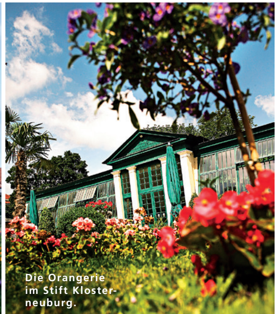
Die Orangerie im Stift Klosterneuburg.

Oleander. Eine Gärtnerin, so heißt es, hat die BesucherInnen genau beobachtet, ehe sie die Idee „Rast im Garten“ mit all diesen Themen umsetzte.