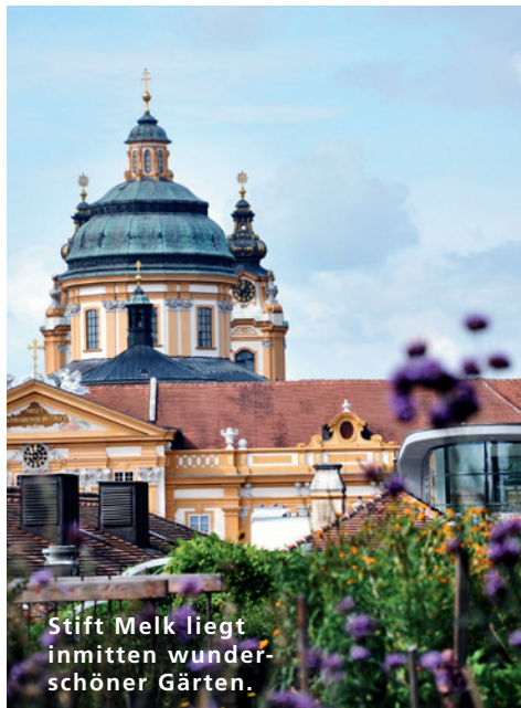
Stift Melk liegt inmitten wunderschöner Gärten.