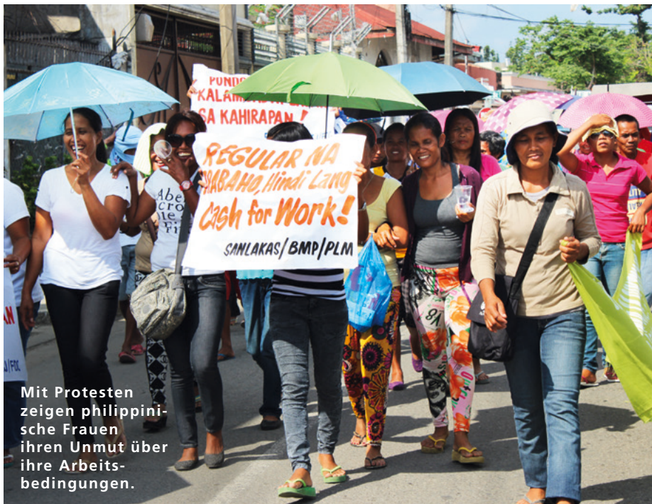
Mit Protesten zeigen philippinische Frauen ihren Unmut über ihre Arbeitsbedingungen.