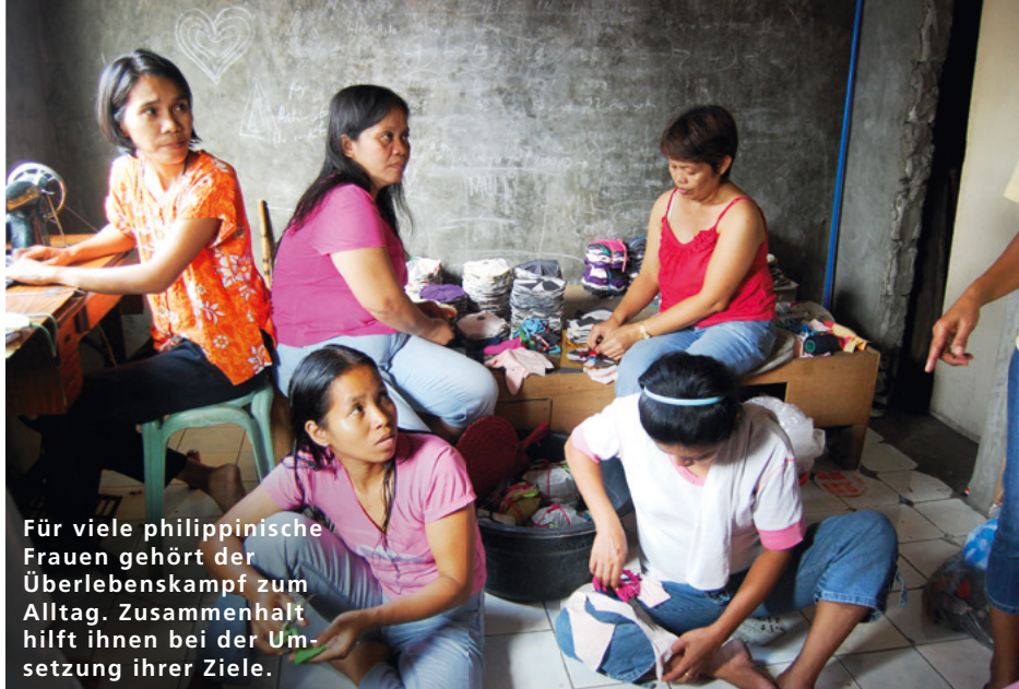
Für viele philippinische Frauen gehört der Überlebenskampf zum Alltag. Zusammenhalt hilft ihnen bei der Umsetzung ihrer Ziele.