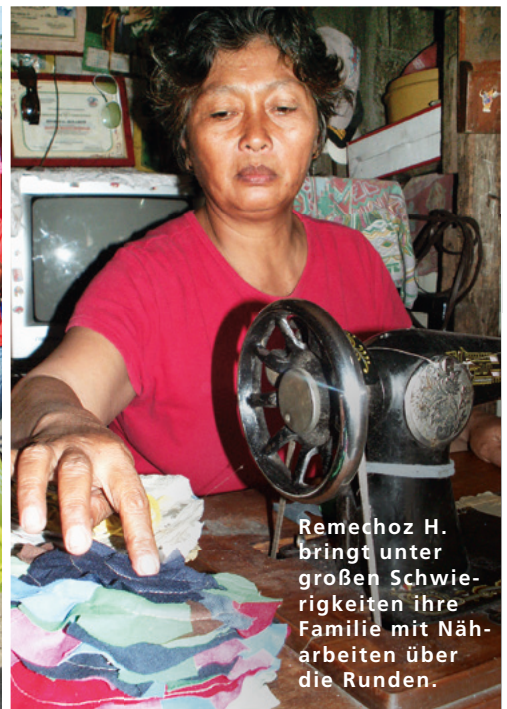
Remechoz H. bringt unter großen Schwierigkeiten ihre Familie mit Näharbeiten über die Runden.